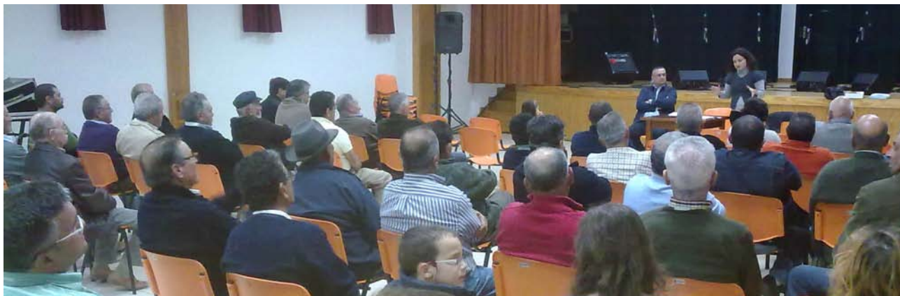
El Consejo Regulador informó a los viticultores de la situación de las ayudas del Posei.