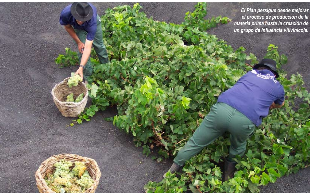
El Plan persigue desde mejorar el proceso de producción de la materia prima hasta la creación de un grupo de influencia vitivinícola.