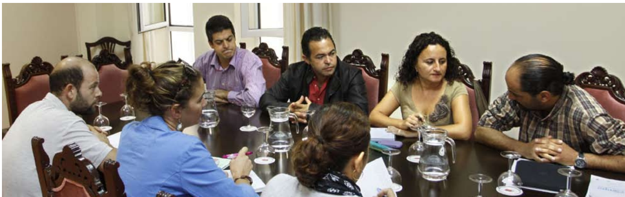
La Mesa está integrada por técnicos del Consejo Regulador, Cabildo y bodegas.