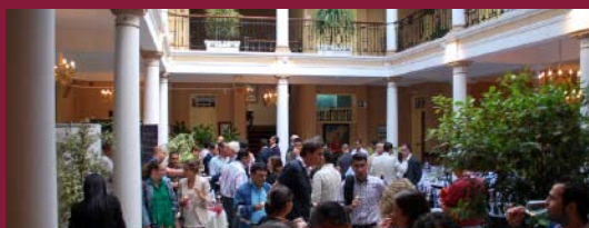
El Hotel Agure de La Laguna acogió el encuentro en Tenerife.