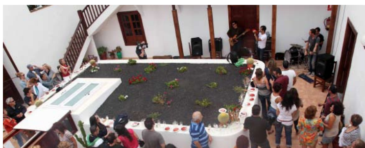
Chocolate Sexy cerró 'Sonidos Líquidos' en Rubicón.