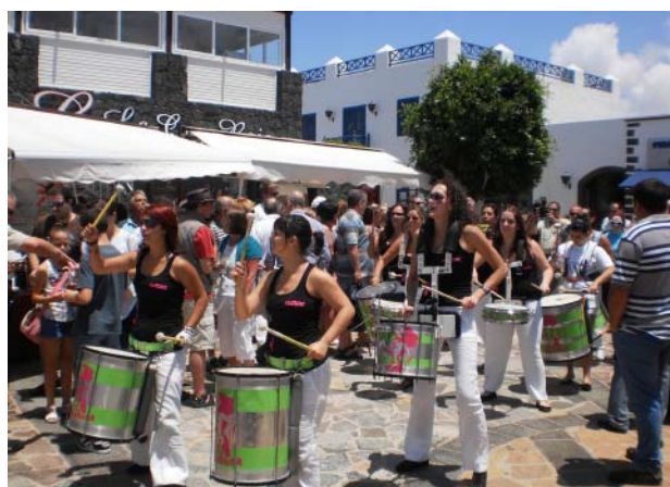
La mañana estuvo amenizada con la presencia de una batucada.