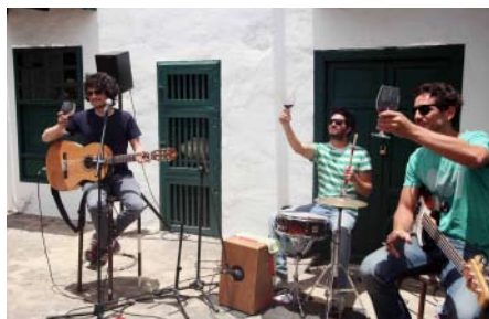
Oscartienealas dio lo mejor de sí en El Grifo.

La parte gastronómica corrió a cargo en cada una de ellos y por este orden de la Terraza Grill Stratvs, el restaurante Liliium gastrobar, el restaurante-asador Getaria y el bar-restaurante Rubicón. Dada el éxito de acogida de la iniciativa y la buena aceptación y demanda que ha tenido la misma, el Consejo Regulador se propone reeditar estos 'Sonidos Líquidos' en el futuro.