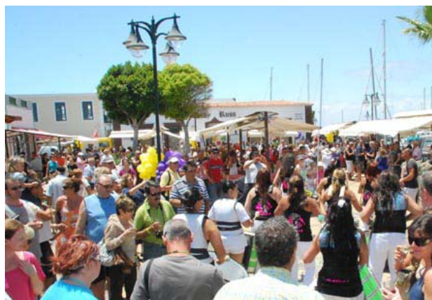
A lo largo de 5 horas se sirvieron cerca de 4.000 degustaciones entre vinos y tapas.

A lo largo de la mañana, amenizada con la presencia de una batucada íntegramente femenina, se llevaron a cabo diversos sorteos con regalos de botellas de Vinos Denominación de Origen para las personas agraciadas.