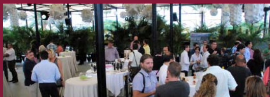
Más de 150 personas asistieron a la presentación en Gran Canaria.

Ambos encuentros, celebrados en la Terraza Tao Garden Club de Las Palmas de Gran Canaria y el Hotel Agure de La Laguna, contaron con el patrocinio de Binter Canarias y disfrutaron de una excelente aceptación por parte de los asistentes y gran repercusión mediática.